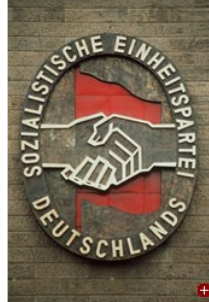
Die Erinnerung an die SED beeinflusst die vorherrschende Meinung über die Linke

Erkennbar wird dies beispielsweise an den Antworten auf eine Frage, bei der die Befragten gebeten wurden, aus einer Liste von 18 Aussagen diejenigen auszuwählen, die ihrer Ansicht nach auf die Partei „Die Linke“ zutreffen. Dass die Partei „ausgesprochen tüchtige Politiker“ hat, sagen heute zwölf Prozent der Bevölkerung, im September 2008 waren es 16 Prozent. Die Aussage, die „Linke“ setze sich für soziale Gerechtigkeit ein, machen heute 37 Prozent, vor zwei Jahren waren es 42 Prozent. Dass sie sich „für die kleinen Leute“ engagiert, trauten der Partei vor zwei Jahren 43 Prozent zu, heute sind es noch 35 Prozent. Man könnte die Liste noch fortführen. Keine der Veränderungen ist dramatisch. Keine wäre der Erwähnung wert, wenn es sich um Einzelfälle handelte, doch zusammengefasst gewinnen die Befunde an Aussagekraft. Aus der Marktforschung ist dieses Muster bekannt als Kennzeichen schwächer werdender Marken: Das Profil ändert sich nicht grundlegend, doch es wird insgesamt blasser.