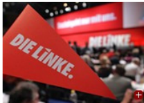
Obwohl der Trend nach links zeigt, sind viele Bürger kritisch

Es ist naheliegend, diese Entwicklung mit den personellen Veränderungen in Verbindung zu bringen, die bei der Partei „Die Linke“ in letzter Zeit stattgefunden haben. Das öffentliche Bild der Partei ist nach wie vor von den Persönlichkeiten Oskar Lafontaine, Gregor Gysi und Lothar Bisky geprägt, die das politische Leben in Deutschland lange mitbestimmt haben. Ihre Nachfolger in der Parteiführung haben bisher keinen vergleichbaren Bekanntheitsgrad und kein vergleichbares Charisma entwickeln können.